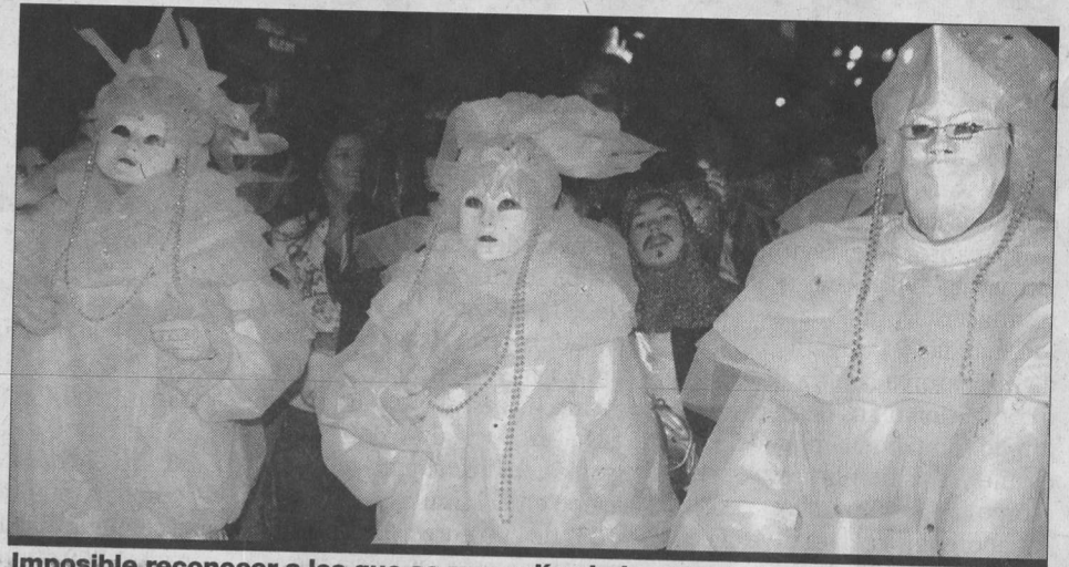
Imposible reconocer a los que se escondían bajo este disfraz.