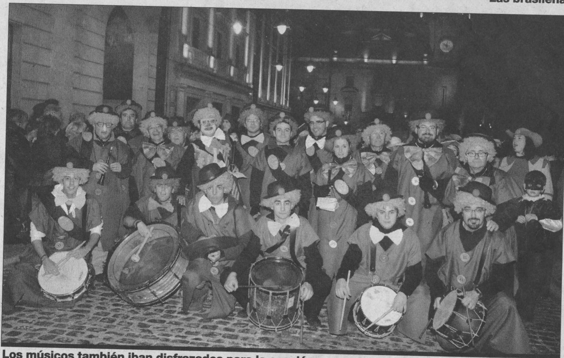
Los músicos también iban disfrazados para la ocasión.